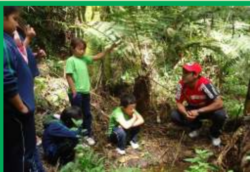
Oficina de Educação Ambiental na Reserva Mãe da Mata onde se aprende a conhecer e respeitar as águas e nascentes.