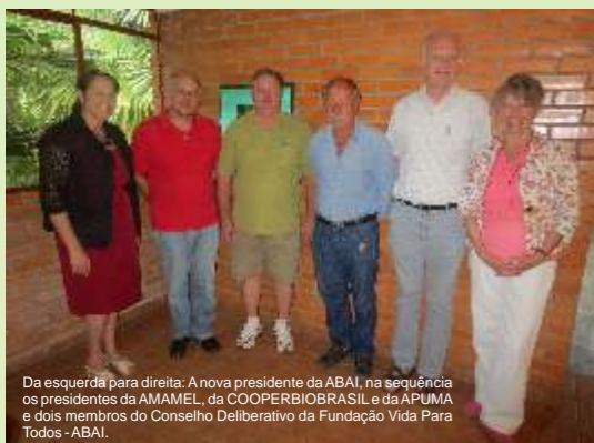
Da esquerda para direita: A nova presidente da ABAI, na sequência as presidentes da AMAMEL, da COOPERBIOBRASIL e da APUMA e dois membros do Conselho Deliberativo da Fundação Vida Para Todos - ABAI.